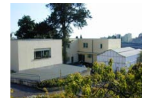
Nuovi laboratori e uffici

Le attività svolte dall'UR sono coerenti con la politica agraria dell'Unione Europea, nazionale e regionale, nonché con le richieste degli operatori economici del settore. La valorizzazione e la tipizzazione del fiore italiano è uno dei princi-