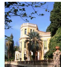
Villa Bel Respiro sede del CRA-FSO

Unità di Ricerca per la Floricoltura e le Specie Ornamentali