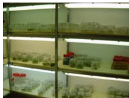
Camera di Coltura

Le ricerche fanno capo a programmi finanziati dal CRA, dal MiPAAF, dall'Unione Europea, dal CNR, dalle Regioni e anche, in parte, da privati. I risultati sono pubblicati su riviste