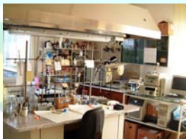
Laboratorio di biochimica

Costituisce una linea di ricerca che mira ad approfondire le conoscenze circa i rapporti ospite-parassita, al fine di una efficace programmazione della difesa: vengono